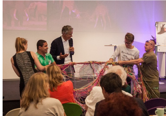
een sterk netwerk!