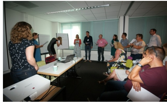
Workshop gemeente Den Bosch

De Gemeente Den Bosch heeft vervolgens laten zien hoe zij met deze casuïstiek zijn omgegaan. Deelnemers waren daarbij vooral aangenaam verrast over hoe consequent de gemeente de regisseursrol neerlegt bij het wijkteam. Het sociale wijkteam neemt eigenlijk altijd regie of beslist welke partij dat eventueel beter kan doen.