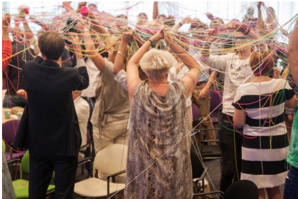
In korte tijd een groot netwerk, en....

Het seminar sloot af met een boodschap om netwerken te versterken wat samenwerken makkelijker maakt. Zo werden in korte tijd een jeugdreclasserder/gezinsvoogd, een wethouder, een jongerencoach, een IGZ inspecteur en een NJI medewerker aan elkaar gekoppeld door een draad. Zij bleken allemaal iets voor elkaar te kunnen betekenen maar spraken elkaar in het dagelijks leven nauwelijks. Het seminar eindigde in een zaal vol netwerken en draden, een verbinding was gelegd!