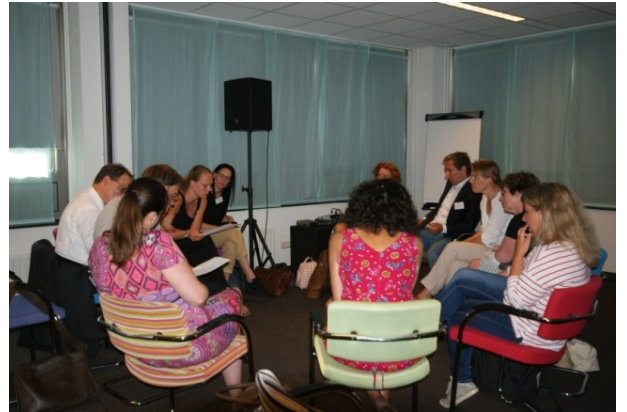
Workshop gemeente Smallingerland

De deelnemers van de workshop gingen vervolgens in drie groepen aan de slag met een complexe casus, waarbij de vraag was hoe de deelnemers de casus zouden aanpakken. Vooraf was aan de deelnemers al gevraagd om na te denken over good practices binnen hun eigen gemeente over (geslaagde) samenwerking. Mede vanuit dat perspectief kon naar de casus worden gekeken. Binnen Smallingerland bleek in elk geval de 'scharrelruimte' van belang om tot oplossingen te komen en lijkt het te lukken (de casus is nog niet afgerond) om toe te werken naar een duurzame oplossing.