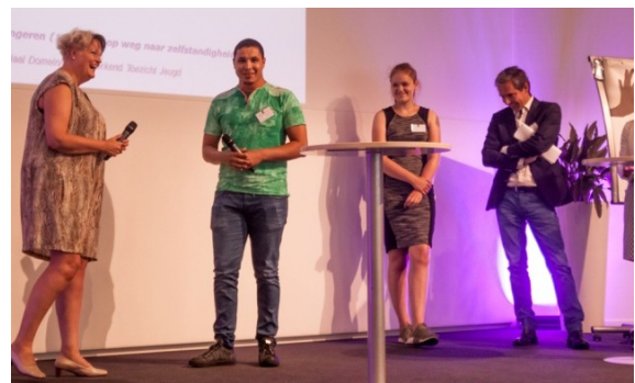
Jongeren in gesprek met gemeenten